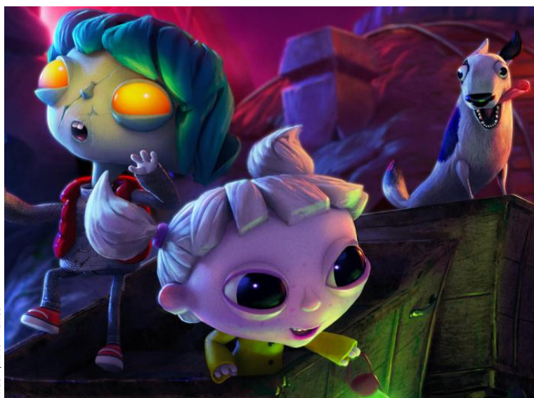
Atlas V, Arte France