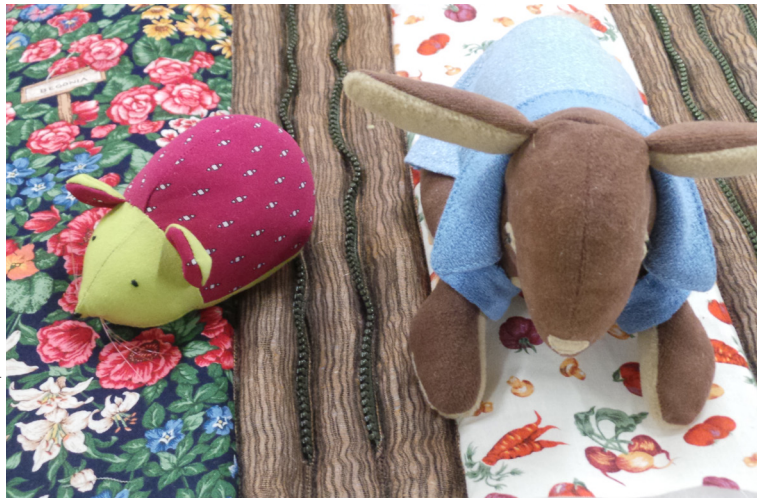
Acora - Médiathèque de Roanne