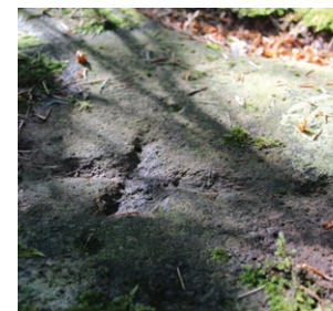
Le pont de l'Ours sur le ruisseau de Malgoutte.

4 Prendre la route à gauche, passer devant le petit Pont de l'Ours et retrouver la route départementale. La longer sur la droite. Prendre la 1 ère route à droite, qui vous mène à Malgoutte. Quitter le goudron et monter sur le large chemin qui longe une allée de hêtres tortueux et la prairie humide de Malgoutte.