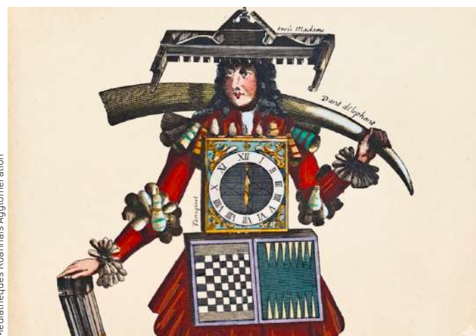
Médiathèques Roannaises Agglomération