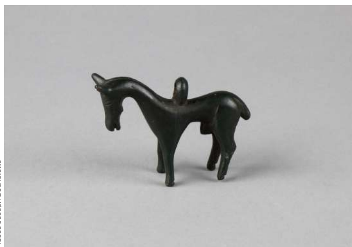
Musée Joseph Déchelette