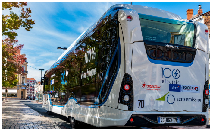
D'ici à 2026, les quatre lignes City seront à 100 % desservies par des bus électriques. Un mode de déplacement plus propre, testé avec succès par Roannais Agglomération en 2018 (photo).

Le 25 mars, le conseil communautaire a décidé de confier l'exploitation technique et commerciale du réseau Star à la société Transdev. Déjà retenu en 2014, le groupe français, spécialiste des transports urbains, poursuivra sa mission pour le compte de Roannais Agglomération jusqu'en 2030. La nouvelle délégation débutera officiellement le 1 er juin. À partir du 1 er septembre, les usagers pourront découvrir une nouvelle offre de déplacements, plus que jamais tournée vers la transition écologique. Sans attendre, nous vous en dévoilons les principales évolutions et nouveautés.