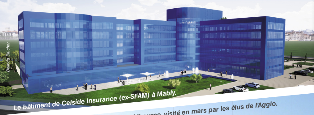
Le bâtiment de Celside Insurance (ex-SFAM) à Mably.